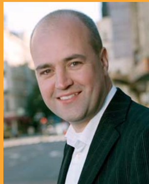
Moderaternas partiledare Fredrik Reinfeldt.