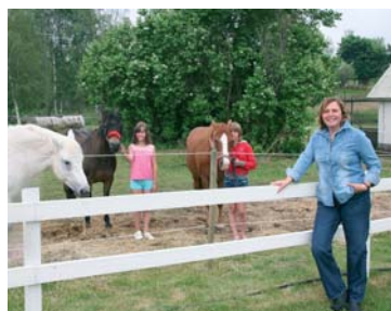
Öka attraktionskraften för kommunen. Gör det möjligt att bo och verka också på landsbygden.