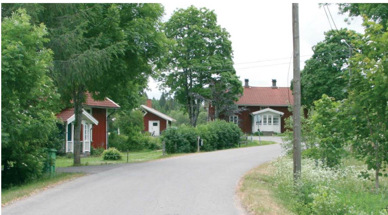
Hela Gislaveds kommun är av största betydelse för utvecklingen av vår gemensamma framtid. Här Lövs by.