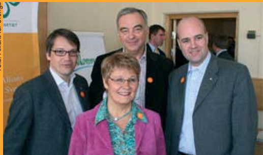
Göran Hägglund (kd), Maud Olofsson (c), Lars Leijonborg (fp) och Fredrik Reinfeldt (m), de fyra partiledarna som tillsammans är "Allians för Sverige". Se även www.maktskifte06.se