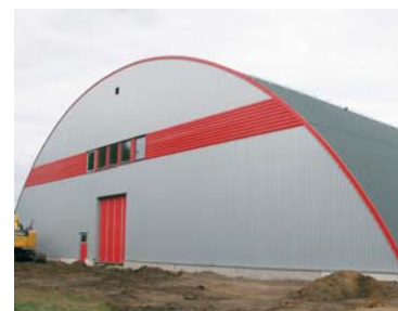
GIS-hallen i Gislaved har tillkommit genom samarbete mellan föreningen och kommunen.