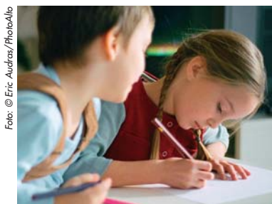
God barnomsorg och bra skola ger en bra start i livet.

Vi tänker en gång för alla ta upp kampen mot brottsligheten och kräver fler poliser till kommunen. Vi vill skapa en bättre tillvaro för alla i Gislaveds kommun och att hela kommunen skall leva och utvecklas.