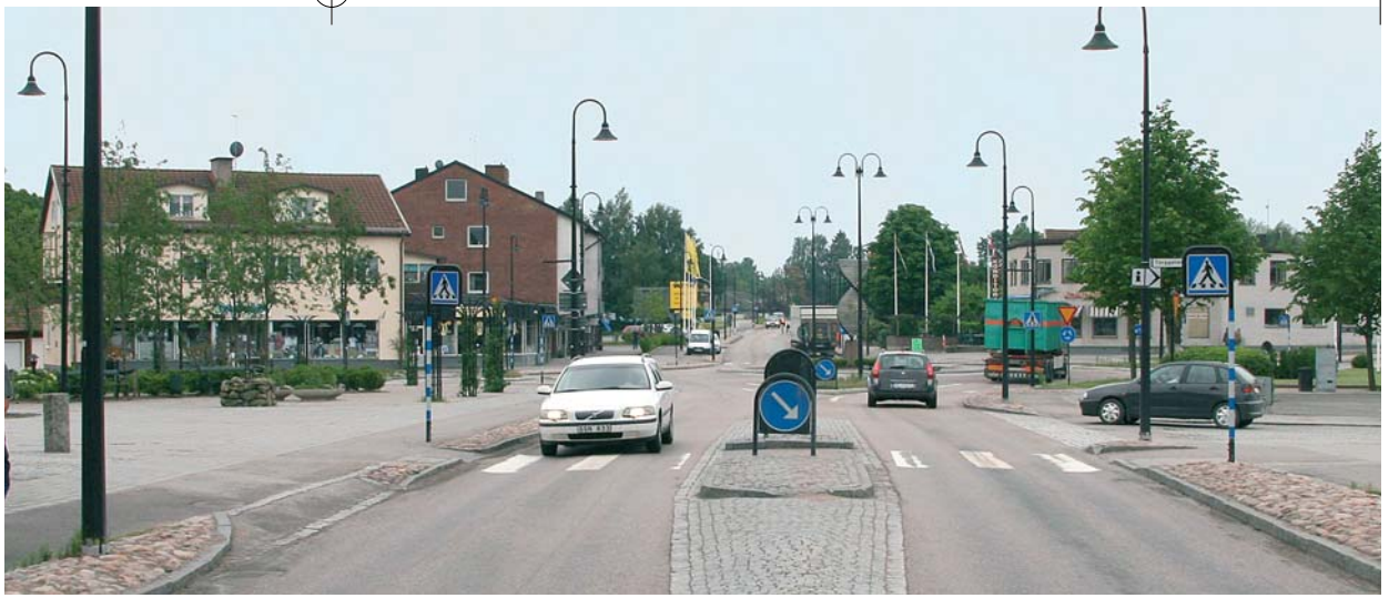
Trafiksituationen är kaotisk genom flera av kommunens orter, som här med riksväg 26 genom Smålandsstenar.