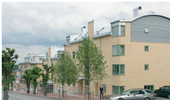
Kvarteret Gripen i Gislaved är en av de senaste byggnationerna i Gislavedshus regi.

Vi vill att AB Gislavedshus skall vara positiva till att sälja delar av fastighetsbeståndet och stimulera hyresgästerna att ta över lägenheter som bostadsrätter. Vi vill se en ökad blandning av upplåtelseformer i bestånden av flerfamiljshus, som Trasten och Furugården. Samtidigt skall AB Gislavedshus behålla ett lägenhetsbestånd i de stora tätorterna i kommunen. Genom aktiva ägardirektiv bör intäkter från försäljningar kunna satsas på områden i kommunen med behov av hyresrätter, för att bli underlätta generationsskiftet på landbygden.