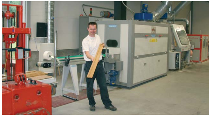
Nya företag skapar nya jobb, både inom företaget och som inköpare av varor och tjänster från andra företag inom kommunens gränser. Här BIMAB i Burseryd.